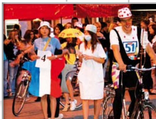
La fête de fin d'année avec le défilé extravagant