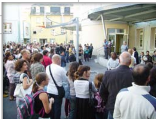
La rentrée des classes