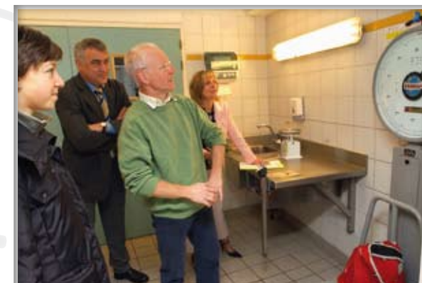
Pesée des cartables