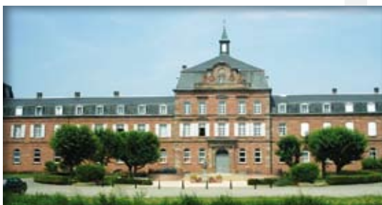
Collège Episcopal de Zillisheim