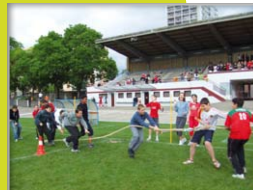
Les challenges sportifs