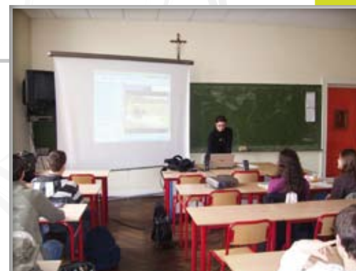
La matinée des entreprises : une incursion dans le monde du travail