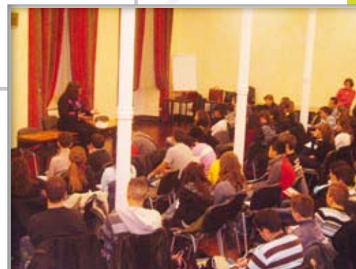
Des animations autour du Salon du Livre