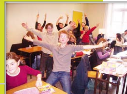
La fête de la Saint-André