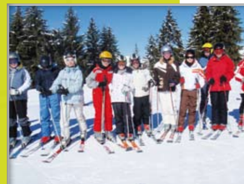
La classe de neige pour tous les élèves de 5 e