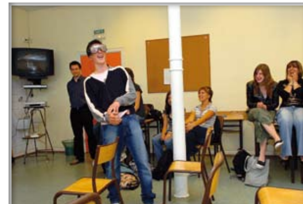
Journée sur les addictions

Les parents d'élèves peuvent adhérer à l'Association des Parents d'élèves de l'Enseignement Libre (APEL). A Saint André, les parents d'élèves sont particulièrement actifs :