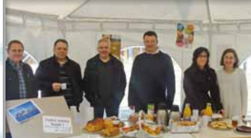
Vente de gâteaux au profit d'un Voyage aux Etats-Unis

Elles montrent toutefois la nécessité d'une solidarité active et d'un travail en commun des parents avec les autres composantes de la communauté éducative.