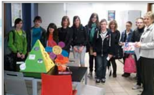
Concours « Un métier d'avenir » en 4 ème