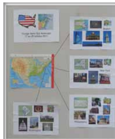
Journée Portes Ouvertes