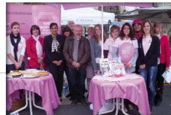
Journée d'Octobre Rose Prévention contre le Cancer du Sein