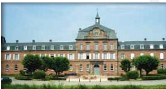
Collège Episcopal de Zillisheim