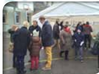
Portes Ouvertes Collège et Lycée général 2015