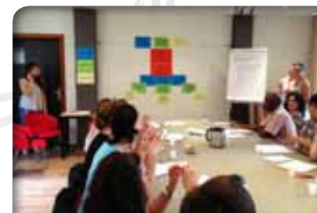
Situation d'évaluation collective