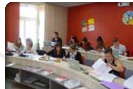
Salle de formation