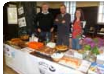
Portes Ouvertes Lycée technologique 2015