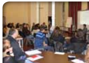
Soirée formation des parents correspondants octobre 2015