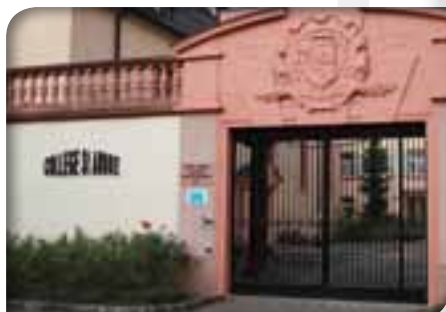
Collège Épiscopal Saint Etienne à Strasbourg