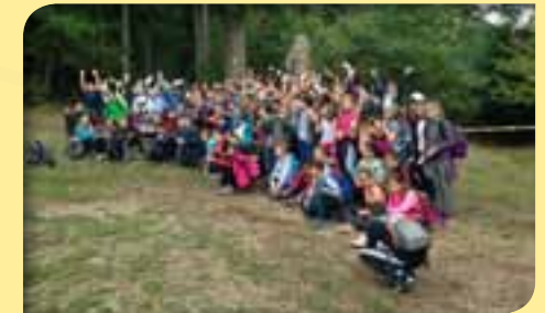
Pèlerinage à Lourdes