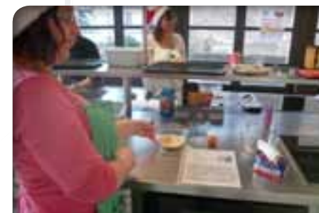
Formation thématisée à l'intervention sociale