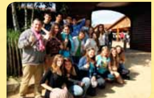
Séjour à Taizé