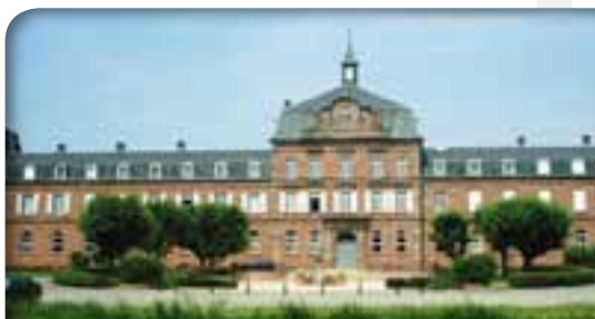
Collège Episcopal de Zillisheim