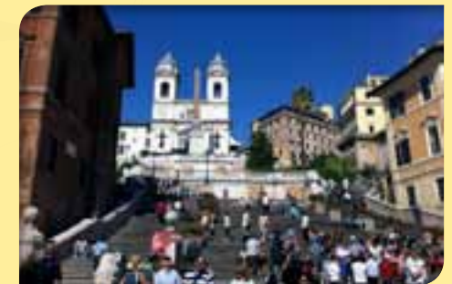
Voyage à Rome