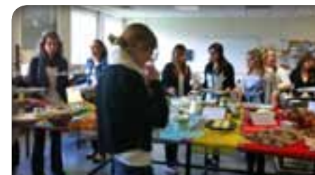
Organisation d'une activité « Petit-déjeuner équilibré » en collaboration avec les élèves du Collège Molière de Colmar