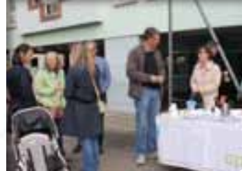
Accueil des élèves de 6 ème

Les actions et les différents événements qui rythment l'année scolaire sont consultables sur le site internet www.apel-saintandre-colmar.fr et témoignent du travail en commun des parents avec les autres acteurs de la communauté éducative.