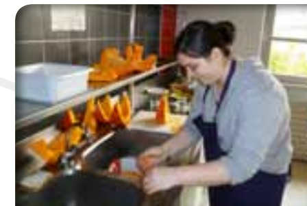
Atelier cuisine au profit des bénéficiaires des Restos du Coeur