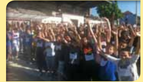
Course de solidarité