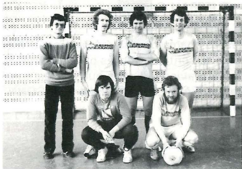
L'équipe à ses débuts