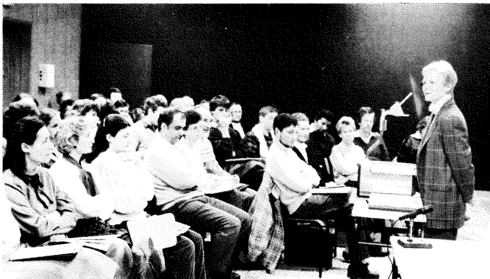
Journée pédagogique du 7 janvier