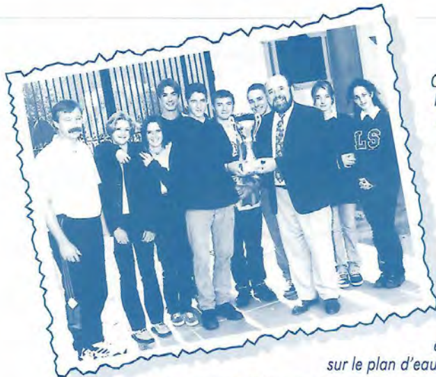
Les optionnaires EPS Volley - Planche à voile remettent cette coupe à notre Directeur.