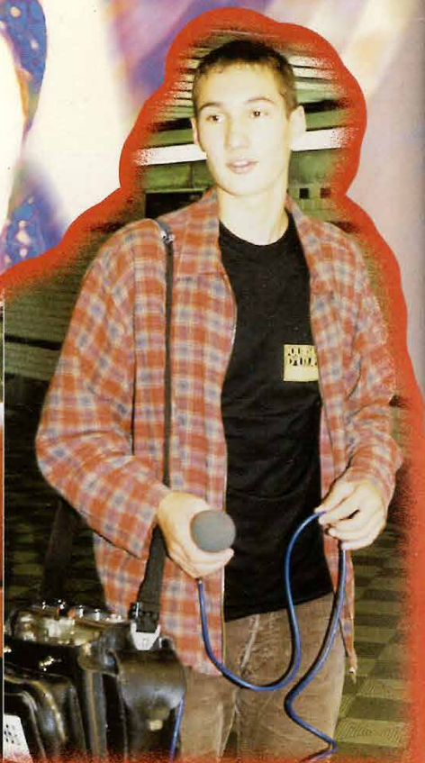
Journalistes d'un jour