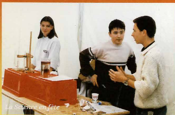
La Science en fête