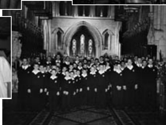
Des concerts de prestige dans toute l'IRLANDE : ici, à la fameuse cathédrale St-Patrick de DUBLIN.

Comment ? Des Petits Chanteurs dans un pub avec un verre de Guinness ? Rassurez-vous, les mineurs étaient au lit... et les majeurs (enfin ceux qui ne surveillaient pas les chambres !) en profitaient pour découvrir l'ambiance des pubs.