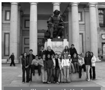
Les élèves devant le Musée du Prado (MADRID)

En avril 2004, 21 élèves de 2 nde et 1 ère du Collège Saint-André ont participé au premier échange organisé avec un établissement marianiste du centre de MADRID: El Colegio Nuestra Señora del Pilar.