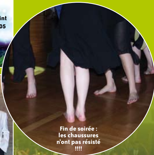
Fin de soirée : les chaussures n'ont pas résisté !!!!