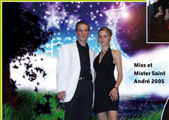
Miss et Mister Saint André 2005