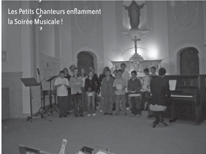
Les Petits Chanteurs enflamment la Soirée Musicale !

Soirée musicale, tartes flambées, barbecue géant dans la cour, sport, stands divers, défilé extravagant, paëlla au self: il y en avait pour tous les goûts !