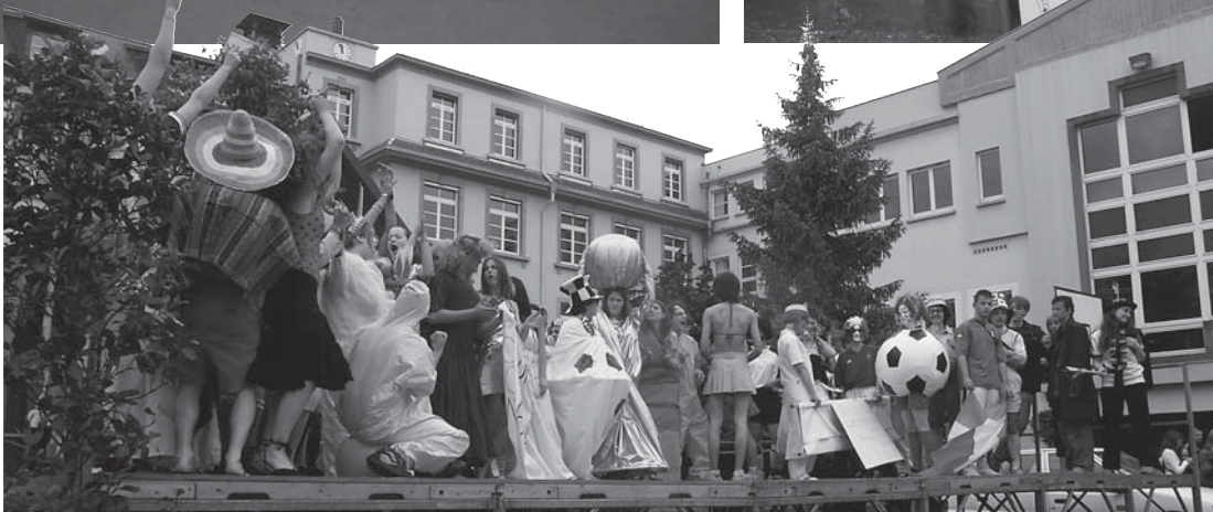
Les lycéens représentant les différents pays participant à la Coupe du Monde