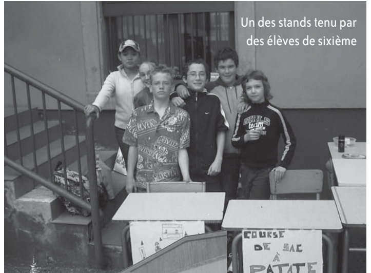
Un des stands tenu par des élèves de sixième