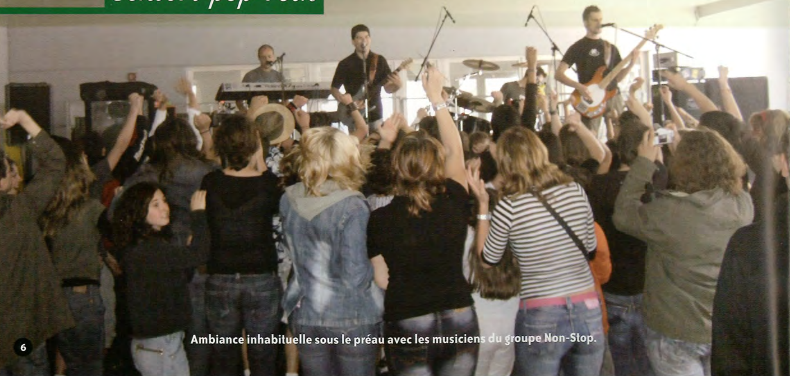
Ambiance inhabituelle sous le préau avec les musiciens du groupe Non-Stop.