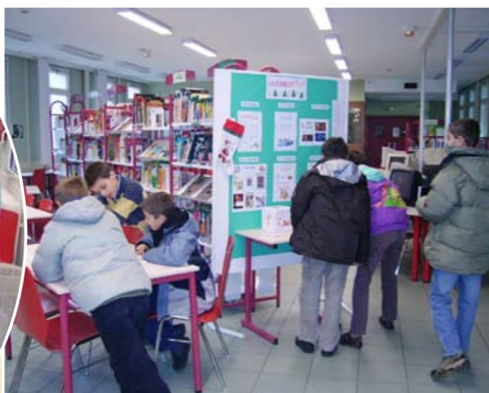
Il faut être le plus rapide pour répondre aux questions du concours.