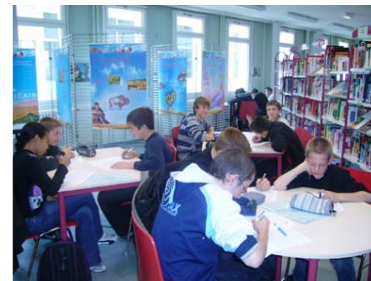
Les élèves de 4ème planchent sur le questionnaire de lecture