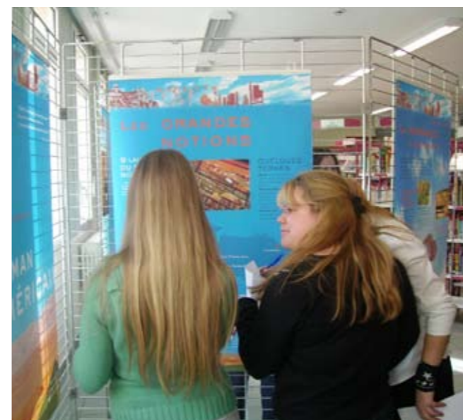
Découverte de la littérature américaine pour les élèves de T° L