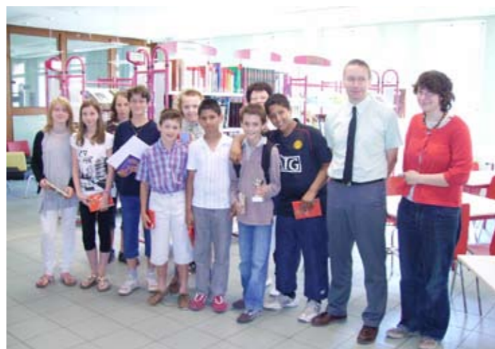
Concours « De la musique encore et toujours »