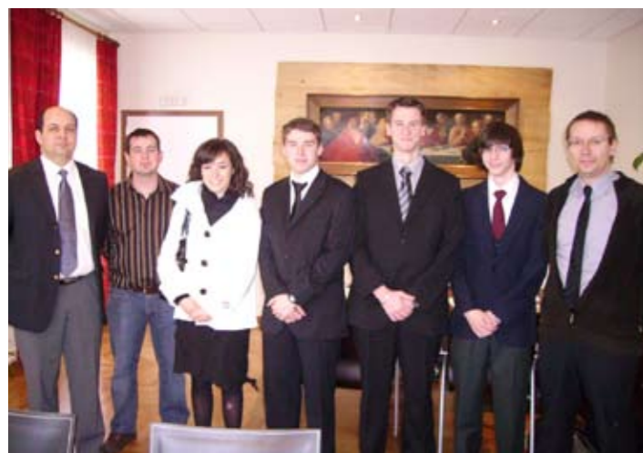
Concours Pax Christi