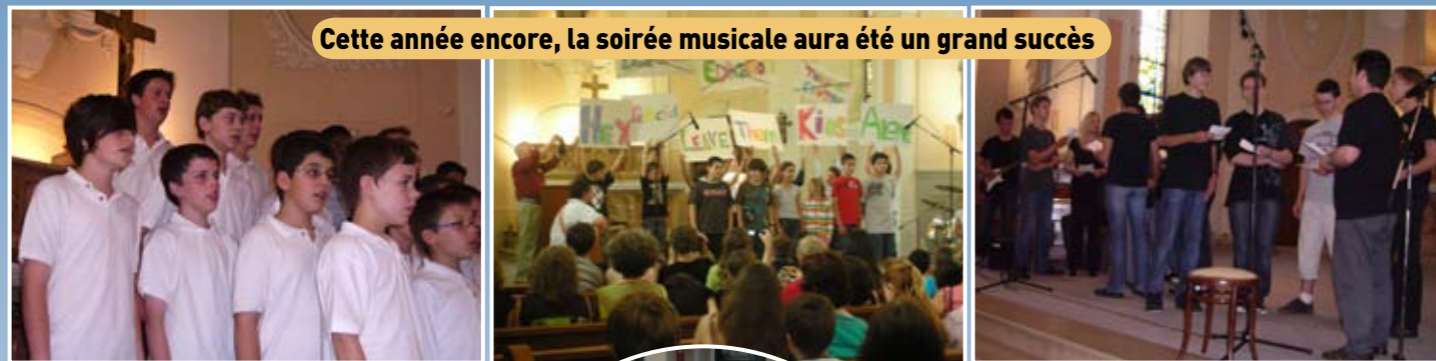
Cette année encore, la soirée musicale aura été un grand succès