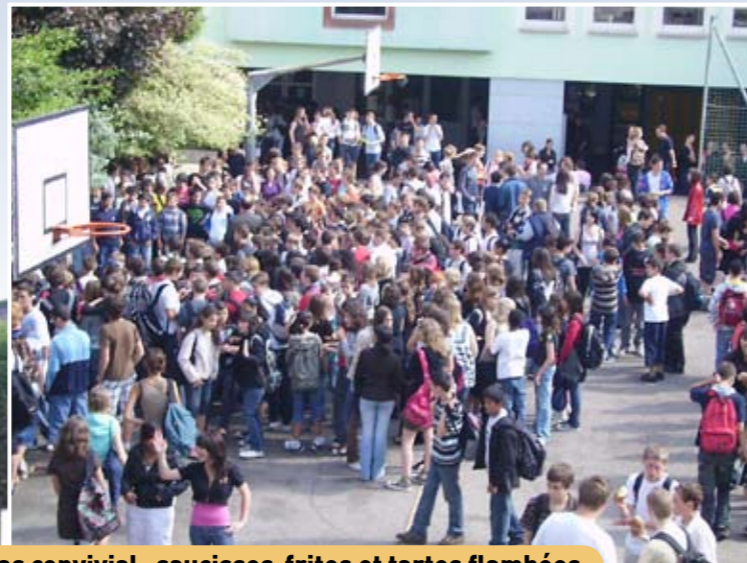
Repas convivial : saucisses-frites et tartes flambées