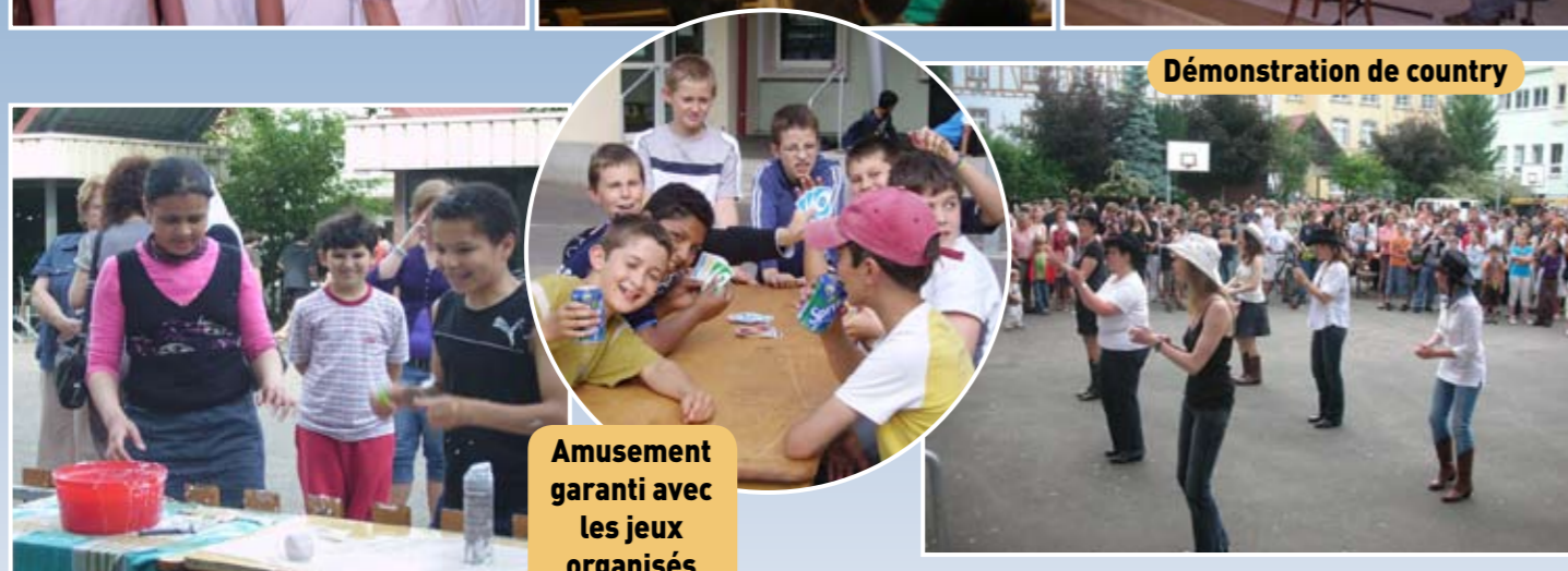
Démonstration de country