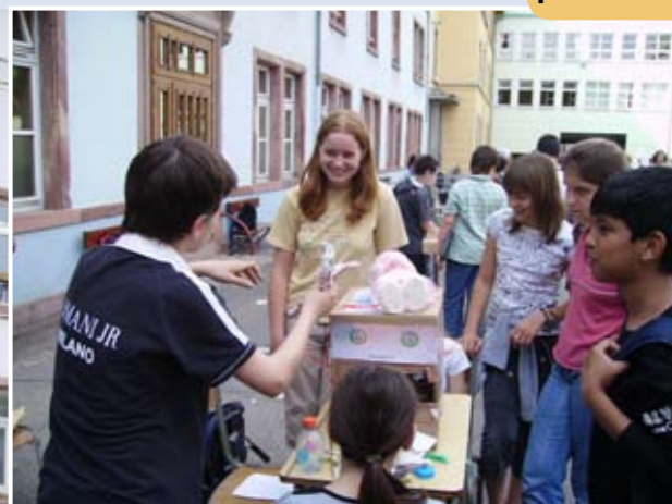
Amusement garanti avec les jeux organisés par les 6èmes