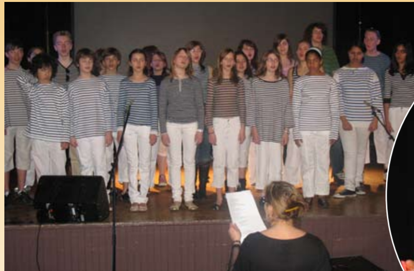
Toute la troupe est sur le pont

La soirée cabaret a fait une escale remarquée au Cercle Martin, samedi 31 mars 2008, sous les applaudissements d'un public fidèle et enthousiaste.