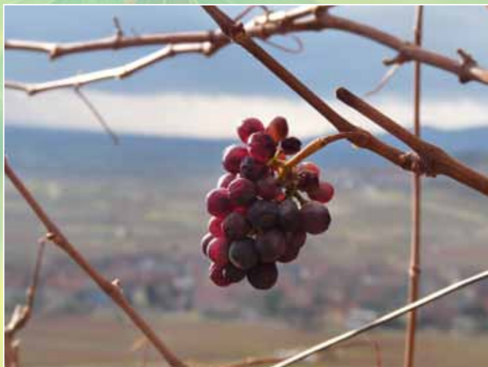
La vigne est belle, admire-la - 1 ère 3A