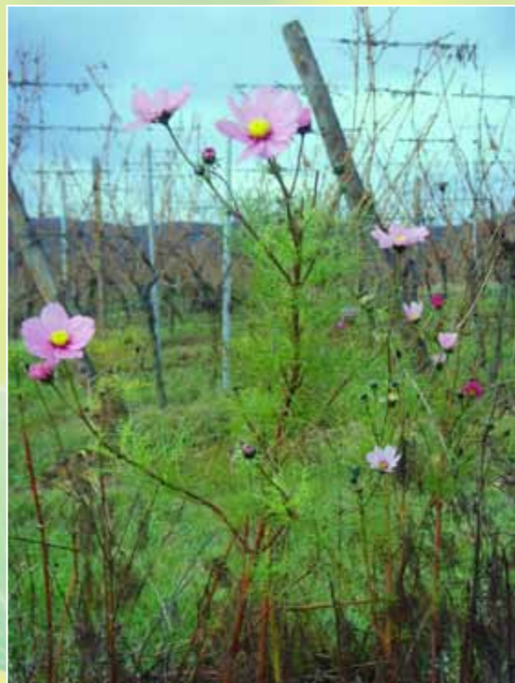
La vie est nature, respirons-la... - 1 ère 7