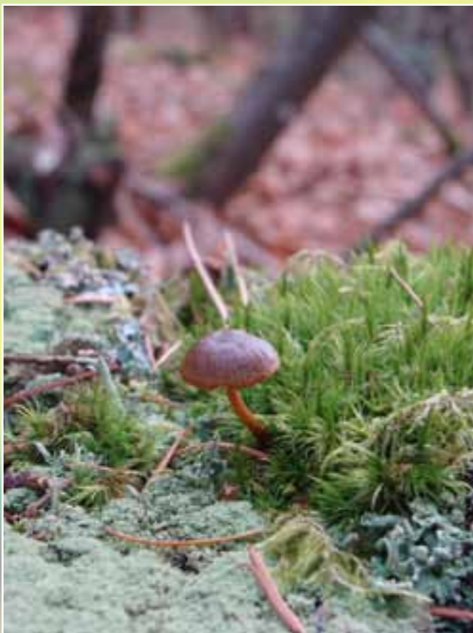
Bats-toi pour vivre si tu ne veux pas être écrasé - 1 ère 2