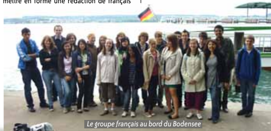
Le groupe français au bord du Bodensee

sur les problèmes liés à l'exploitation de la centrale nucléaire de Fessenheim et à corriger leur compte-rendu concernant leur journée à Colmar. Après un très bon déjeuner pris au réfectoire de l'école, nous sommes dirigés vers Uberlingen, petite ville située sur le Bodensee. Nous y avons découvert un centre-ville dynamique, une cathédrale gothique du XIV e siècle ainsi que des fortifications moyenâgeuses. Les bords du lac offraient un paysage magnifique, l'on pouvait même apercevoir la Suisse, sur la rive opposée du lac. Nous avons quitté cet air de vacances, à regret, en promettant à nos correspondants de revenir l'année prochaine ... un peu plus longtemps afin de mieux profiter de l'échange.