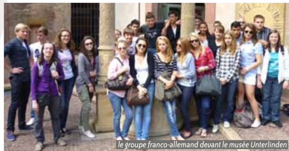
Le groupe franco-allemand devant le musée Unterlinden