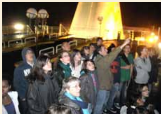
C'est le samedi 9 avril 2011 que nous avons entamé notre beau périple à travers l'Irlande et l'Angleterre.