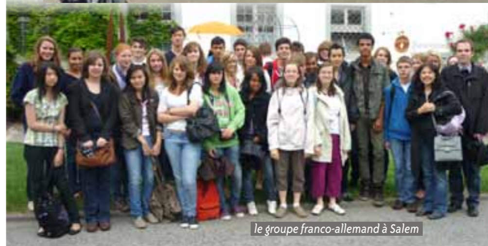
Le groupe franco-allemand à Salem