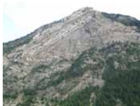
Pli de St Clément

Ces journées passées ensemble nous ont également permis de renforcer les liens avec des camarades d'autres classes que nous n'avons pas le temps d'apprécier au lycée.