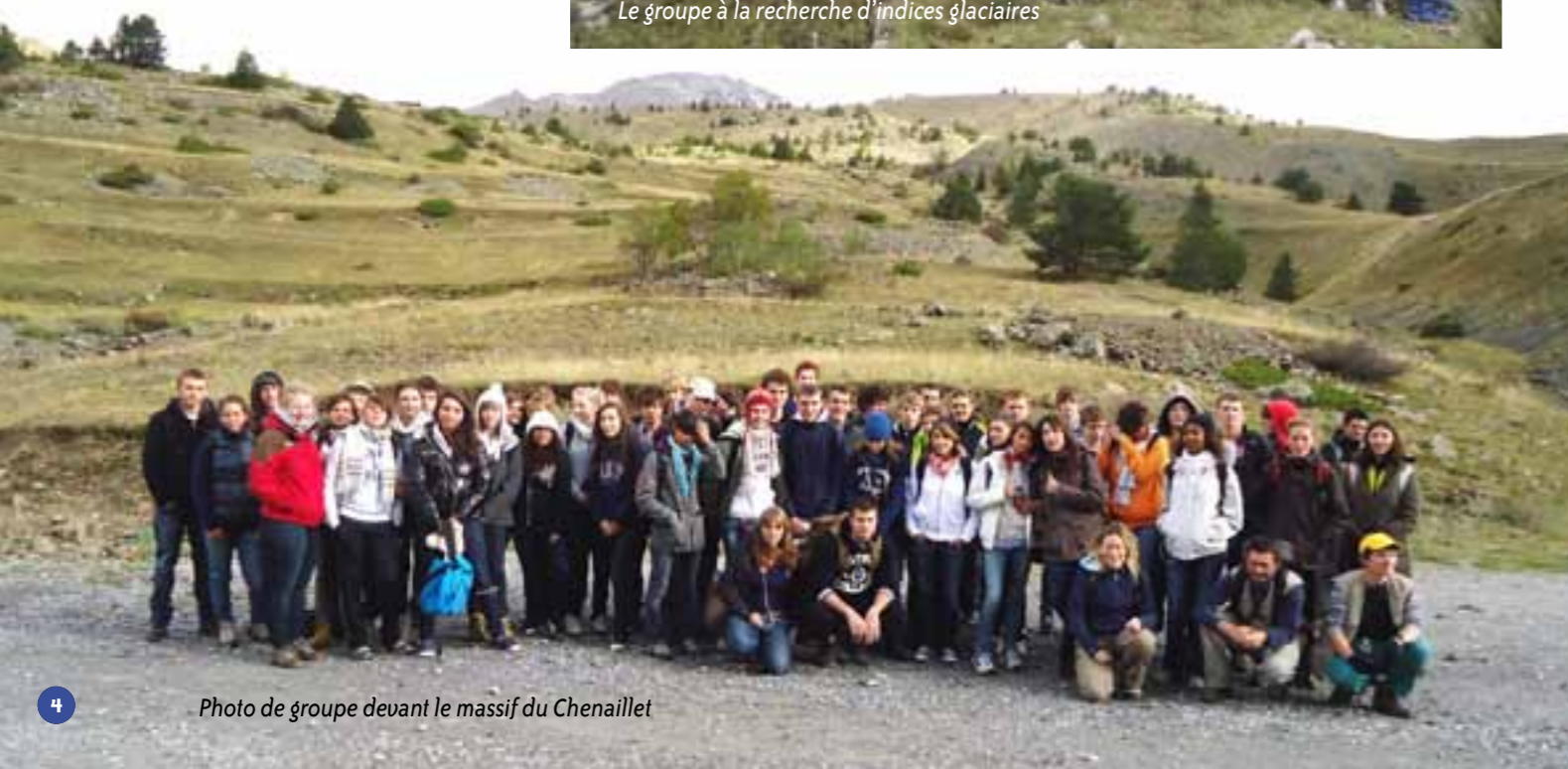
Photo de groupe devant le massif du Chenaillet