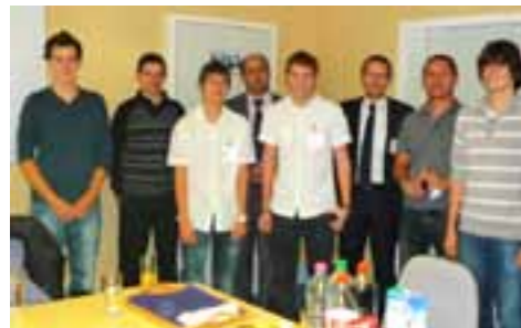
Entreprise MAHLE Pistons