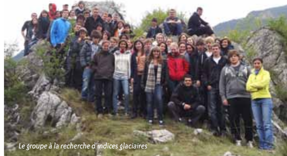
Le groupe à la recherche d'indices glaciaires