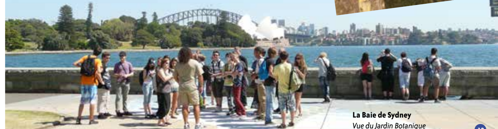
La Baie de Sydney Vue du Jardin Botanique