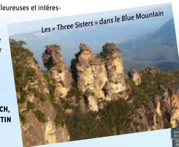
Les « Three Sisters » dans le Blue Mountain