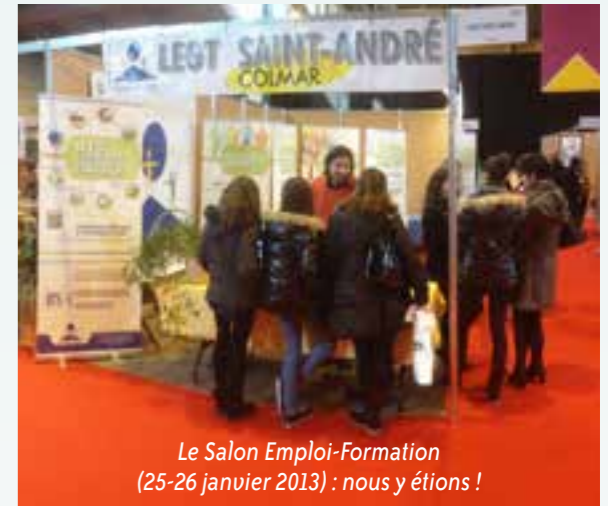
Le Salon Emploi-Formation (25-26 janvier 2013) : nous y étions !

A venir: une immersion en lettres-philosophie le 12 février et une immersion en droit le 14 février.