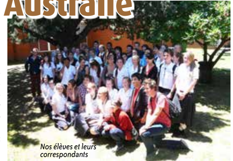
Nos élèves et leurs correspondants

Le long vol hélas nécessaire pour atteindre l'autre côté de la planète n'aura pas entamé l'enthousiasme du groupe! Des visites passionnantes (l'aquarium de Sydney ou le musée des bagnards aux Hyde Park Barracks pour ne citer qu'eux), des lieux merveilleux à découvrir (comme les jardins botaniques, la traversée du Sydney Harbour Bridge ou encore le quartier historique de The Rocks par exemple), ainsi qu'une douce chaleur surprenante pour un mois de novembre nous ont permis de savourer la vie trépidante de Sydney.