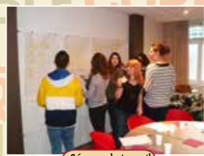
Séance de travail avec les élèves