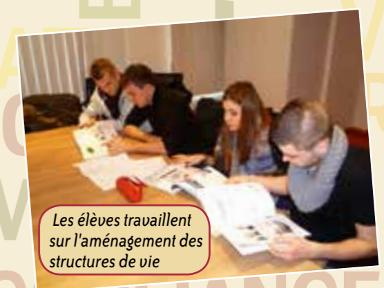
Les élèves travaillent sur l'aménagement des structures de vie

Je suis une élève parmi les délégués des premières qui ont pu participer au projet de l'annexe technologique de Saint André.