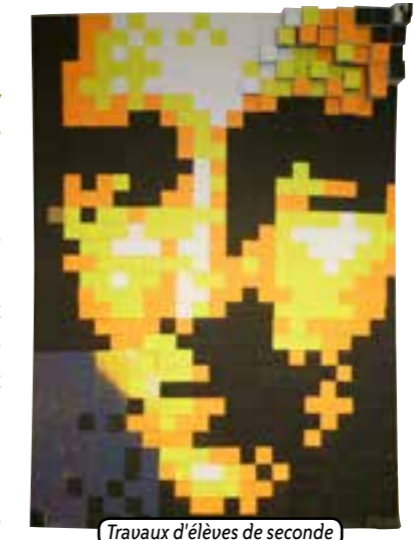
Travaux d'élèves de seconde

« La lumière est pour cet artiste le médium de base. À travers ses différentes installations, son travail consistait à mettre en avant un jeu de lumière et d'ombre, tout en exploitant l'anamorphose. »