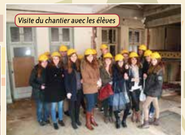
Visite du chantier avec les élèves