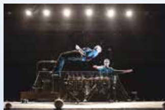
À la salle Europe de Colmar : ARTS DU CIRQUE : Opéra pour sèche-cheveux