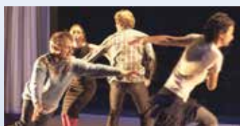
À la Comédie de l'Est de Colmar : THÉÂTRE : Guitou