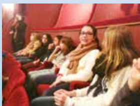
À l'Opéra de Strasbourg : Répétition d'un opéra : La Clémence de Titus Visite de l'Opéra