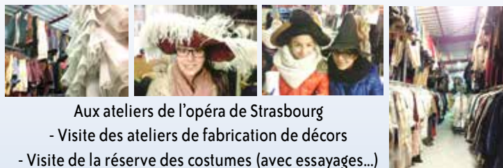
Aux ateliers de l'opéra de Strasbourg - Visite des ateliers de fabrication de décors - Visite de la réserve des costumes (avec essayages...)