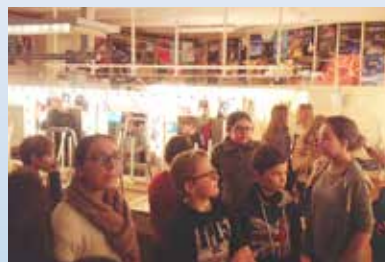
Au Théâtre Municipal de Colmar : OPÉRA : « Il matrimonio segreto »