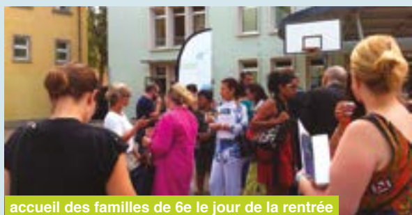
accueil des familles de 6e le jour de la rentrée