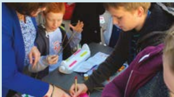
Journées Chapelle ouverte