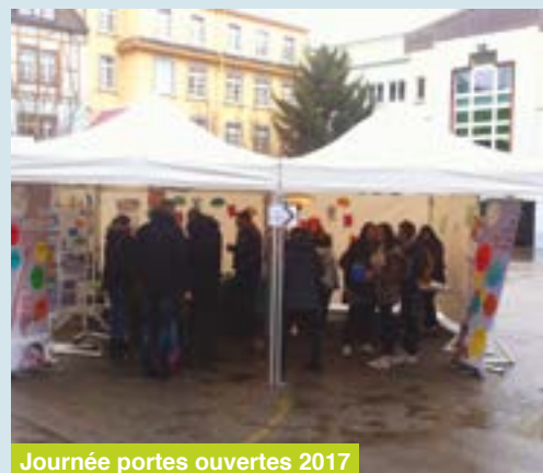
Journée portes ouvertes 2017