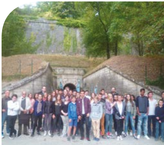
Les 3 e à Verdun devant la citadelle

Cette dynamique s'inscrit dans la période commémorative du centenaire de la Grande Guerre et en rapport avec les programmes de la classe de 3 e .