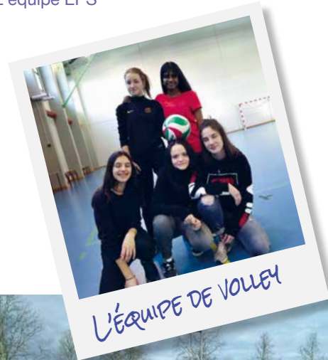
L'ÉQUIPE DE VOLLEY