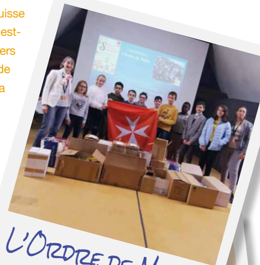
L'ORDRE DE MALTE