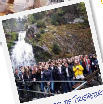
LES CASCADES DE TRIEBERG