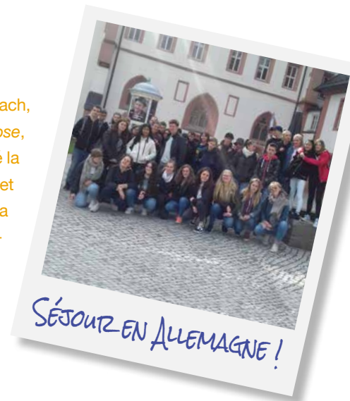
SÉJOUR EN ALLEMAGNE!