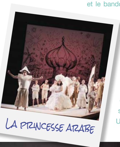
LA PRINCESSE ARABE

la fois savante et populaire de Piazzolla a beaucoup plu à l'ensemble des élèves. À l'issue de la représentation, l'échange avec le responsable du Ballet de l'Opéra National du Rhin a permis à chacun de percevoir l'esprit dans lequel le chorégraphe a souhaité faire ressentir le tango dans cette œuvre. Une belle expérience !