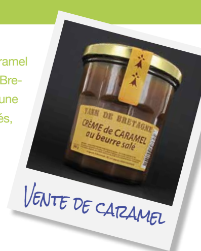
VENTE DE CARAMEL

R ÉPRÉSENTATION aux commissions restauration, pastorale, et aux conseils de gestion & établissement de Saint André.