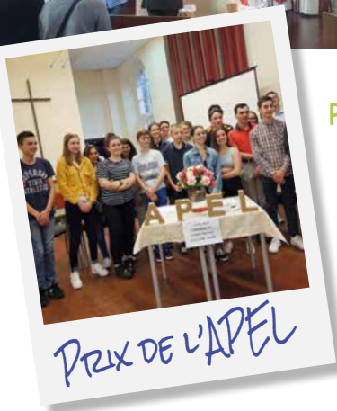
PRIX DE L'APEL

A VEC plus de 200 coureurs ou marcheurs qui nous ont rejoints pour cette belle cause, Saint André remporte une nouvelle fois le prix de l'établissement le plus représenté. L'APEL était présente et a soutenu financièrement l'achat des T-shirts remis à chaque participant.